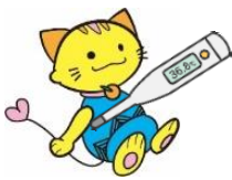
毎朝の検温と健康チェック