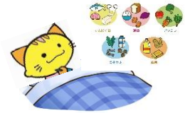
バランスの良い食事・十分な睡眠